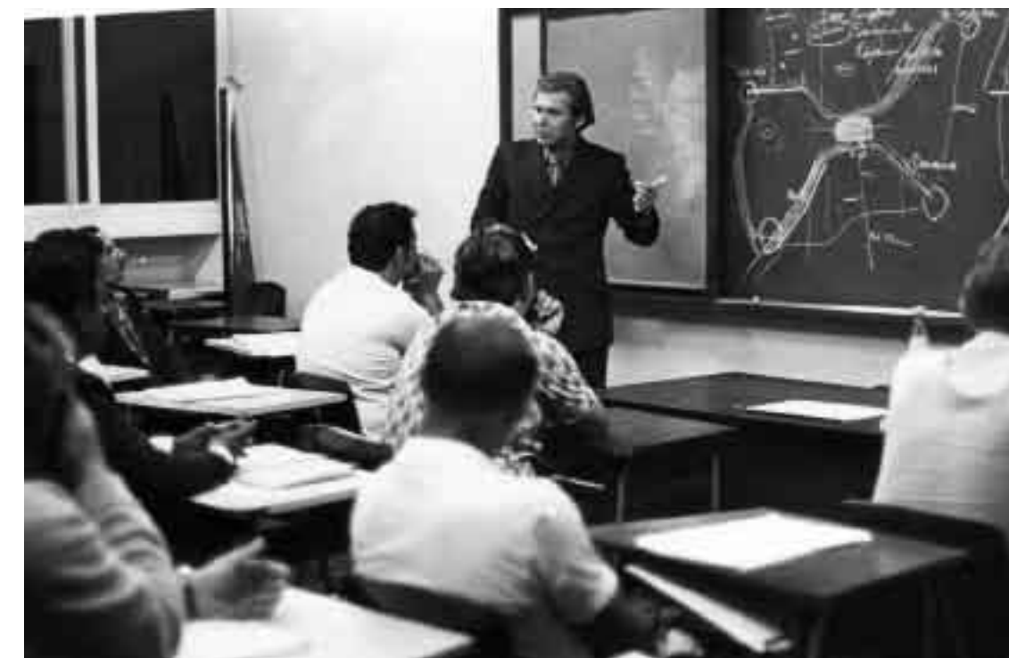
Ensinando taxistas a trabalhar as novas realidades do sistema viário que iria implantar. Anos 70s.

Bem humorado, Lerner disserta com maestria em tor-