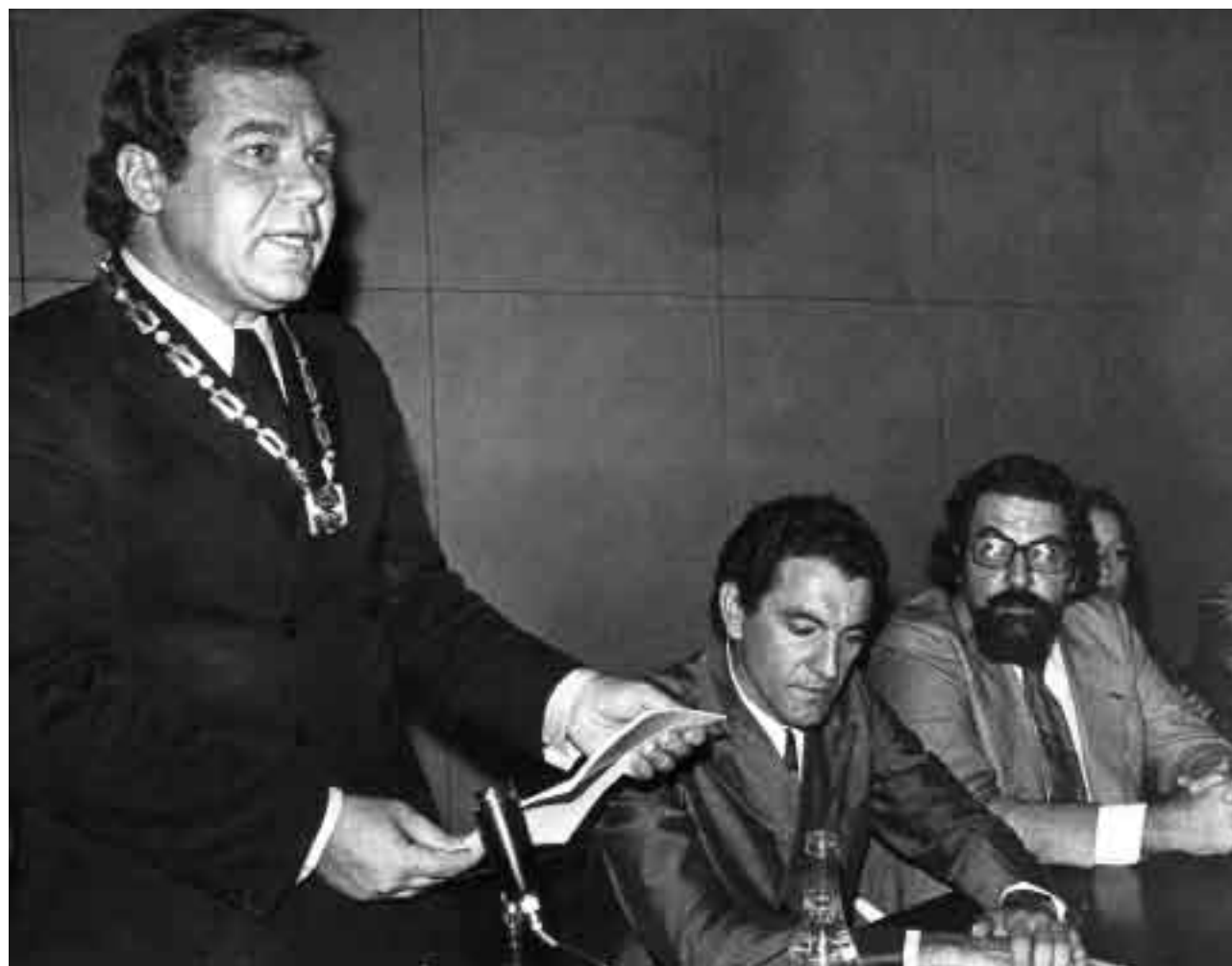
Recebendo homenagem – Colar de Ouro – nos primeiros dias de uma longa e fértil carreira pública.