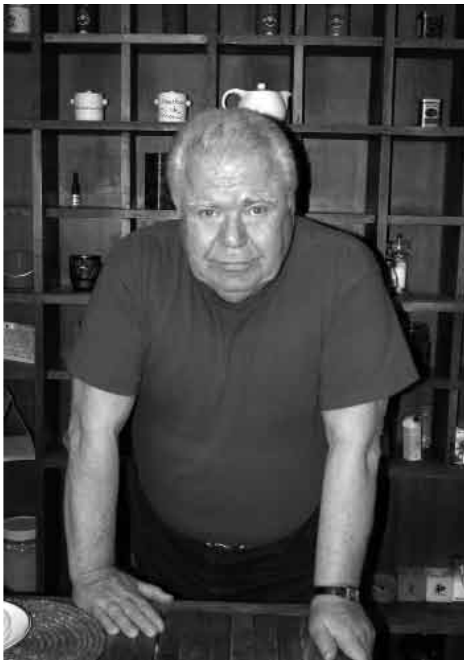
O acupunturista urbano mascateia ideias para um mundo sustentável.