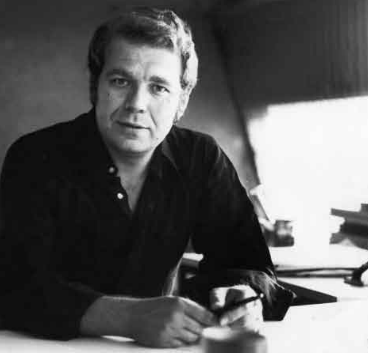
Em 1974, durante o primeiro mandato de prefeito: começo de uma carreira de repercussão mundial.

pital. A cidade industrial que incluiu em sua concepção detalhes essenciais, como medidas para evitar a poluição ambiental de Curitiba. Exatamente o contrário de maledicências políticas que em horário eleitoral chamavam a CIC de “um grande campo de golfe”.