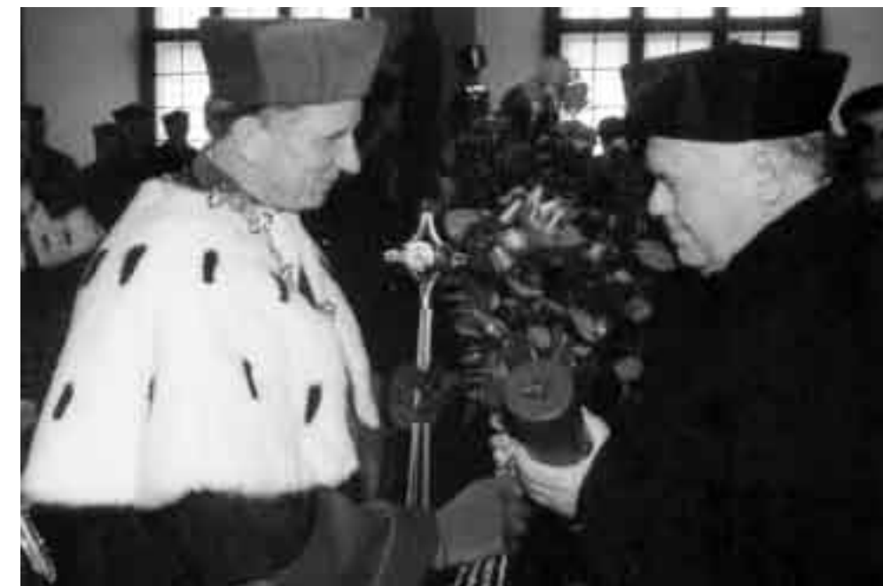
Títulos universitários honorários: reconhecimento à criatividade em urbanismo.

Um bom exemplo de sustentabilidade está ali mesmo, no teto daquela casa que foi seu primeiro investimento imobiliário. Ele a construiu quando tinha 22 anos, com o plus de um teto que garante perfeito isolamento térmico: grama entre o telhado e o forro, que estão lá, úteis, exemplares até hoje.