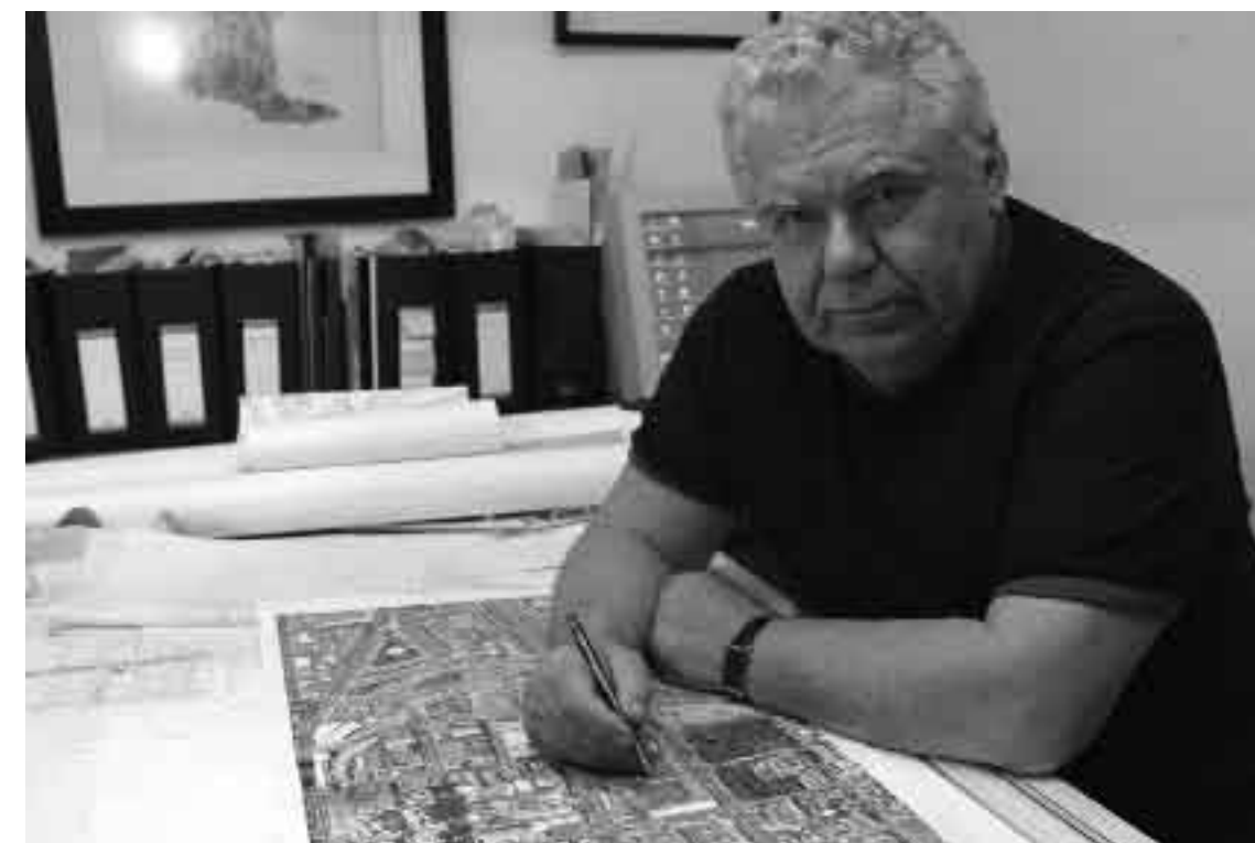
A prancheta do Instituto Jaime Lerner é de onde saem as grandes soluções urbanas que ele leva mundo a fora.

Nada que, de vez em quando, não pudesse ser driblado com criatividade, estilo e, é claro, doses generosas de bom humor. Foi o que ocorreu quando o gravurista Poty Lazarotto requereu à Prefeitura esclarecimentos sobre a realização de uma grande obra pública no Cajuru e que poderia estar afetando a estrutura de casas pertencentes a sua família. Também avesso à burocracia e a suas formas ordinárias de manifestação, Poty encaminhou ao então prefeito um inusitado requerimento em forma de desenho, onde aparecia uma casa a ponto de ser engolida por um ser fantástico. Lerner leu atentamente o documento e não teve dúvidas: despachou um defira-se.