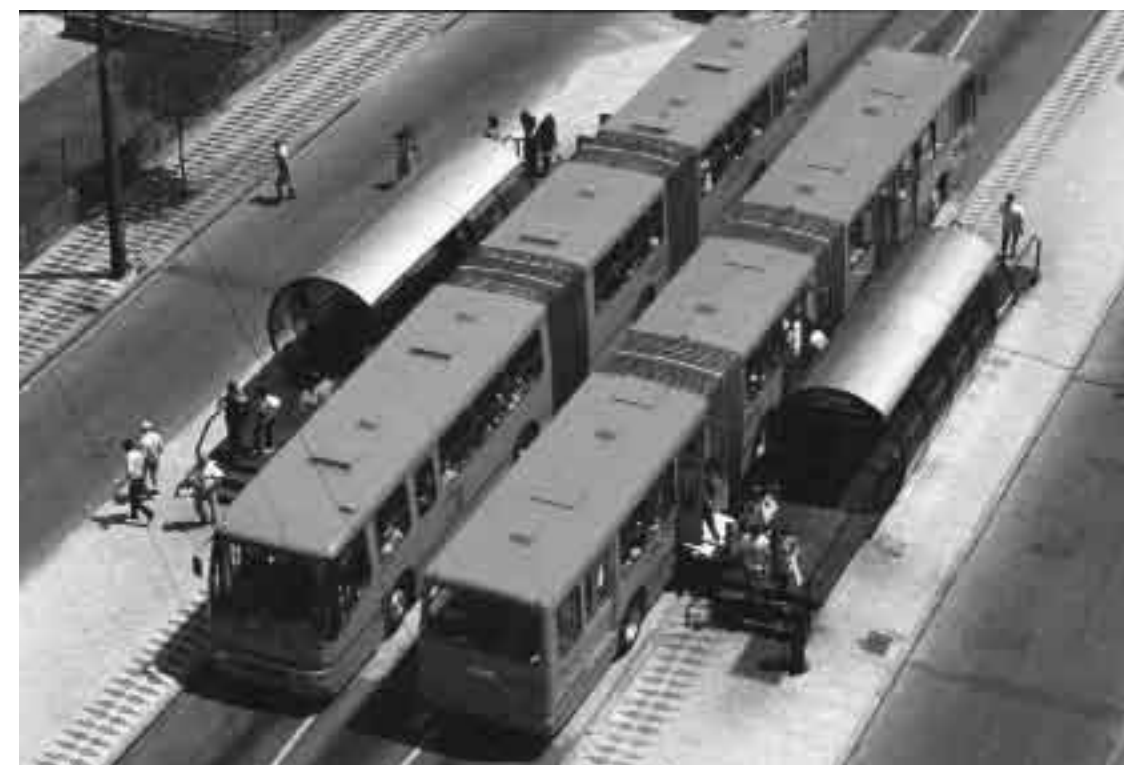
Estações-tubo, ônibus biarticulados, trimários e canaletas exclusivas: Curitiba exporta soluções para transporte de massa.