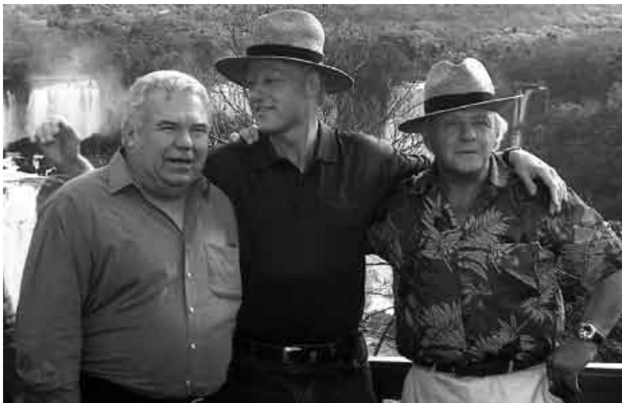
Com o ex-presidente norte-americano Bill Clinton e o ator Anthony Hopkins.