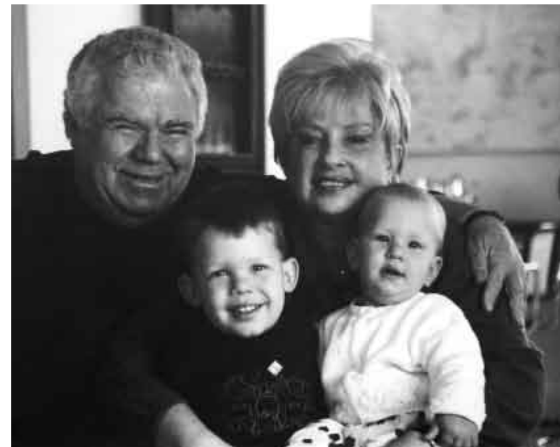
Com Fani e netos.

O conceito público de que o arquiteto desfruta, no entanto, é resultado de uma intensa, constante e muito bem compartilhada sucessão de projetos vitoriosos catapultados sempre por boas e instigantes ideias. Segundo Lechinski, a ideia certa é, invariavelmente, a energia