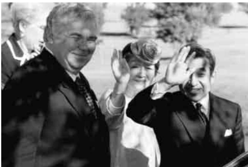
Recebendo os imperadores do Japão.