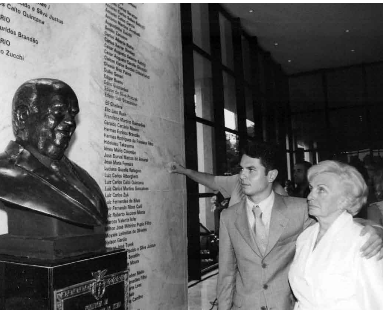
Diante do busto que homenageia o avô, na Assembléia Legislativa do Paraná.