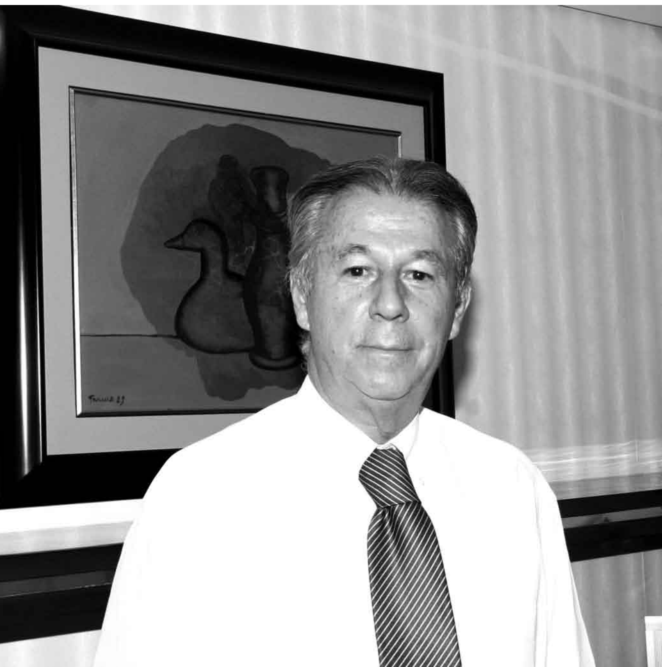
No consultório, fundo musical e atmosfera de artes plásticas.

alidade – e derrubar barreiras – foi facilitada pela vida acadêmica de quatro anos, garantindo-lhe a inserção a partir de referências da cidade. Uma delas, o Chá de Engenharia na Duque de Caxias – por onde passava sobretudo a juventude universitária vinda de todo o Brasil –, as horas gastas com as namoradas e os amigos na Fontana Di Trevi, confeitaria e restaurante que era o must dos anos 60s, na Boca Maldita. Um roteiro que o estudante cumpriria com prazer no footing da João Pessoa, nas ses-