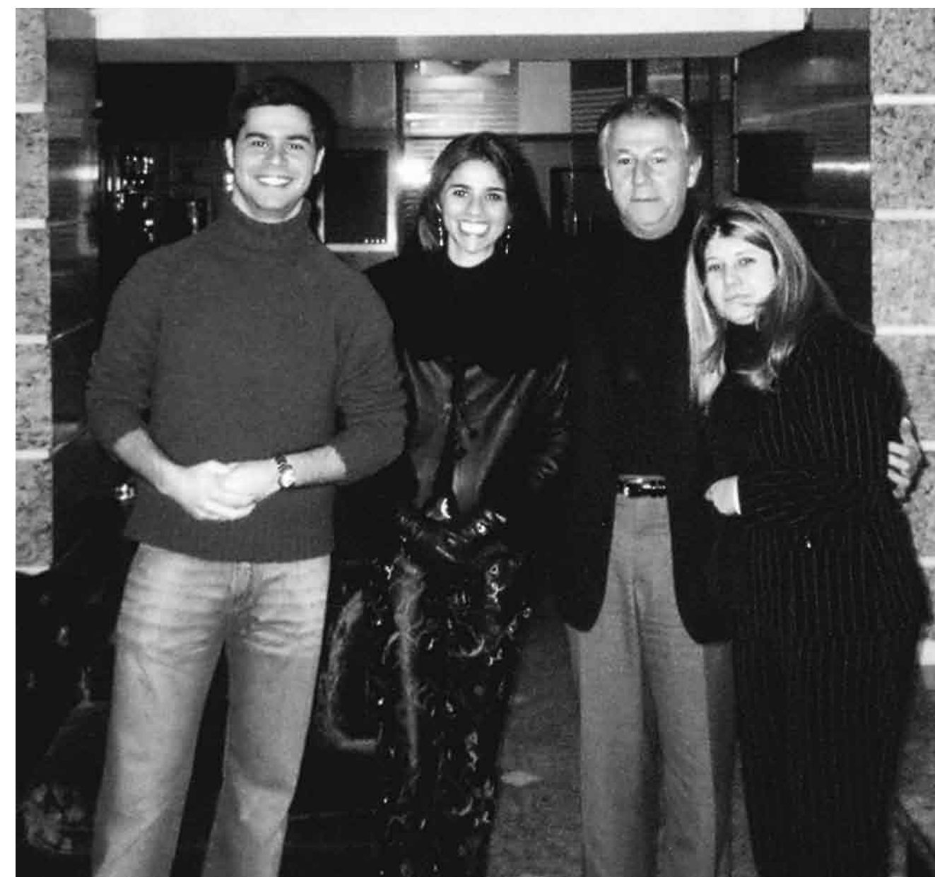
Com os filhos.