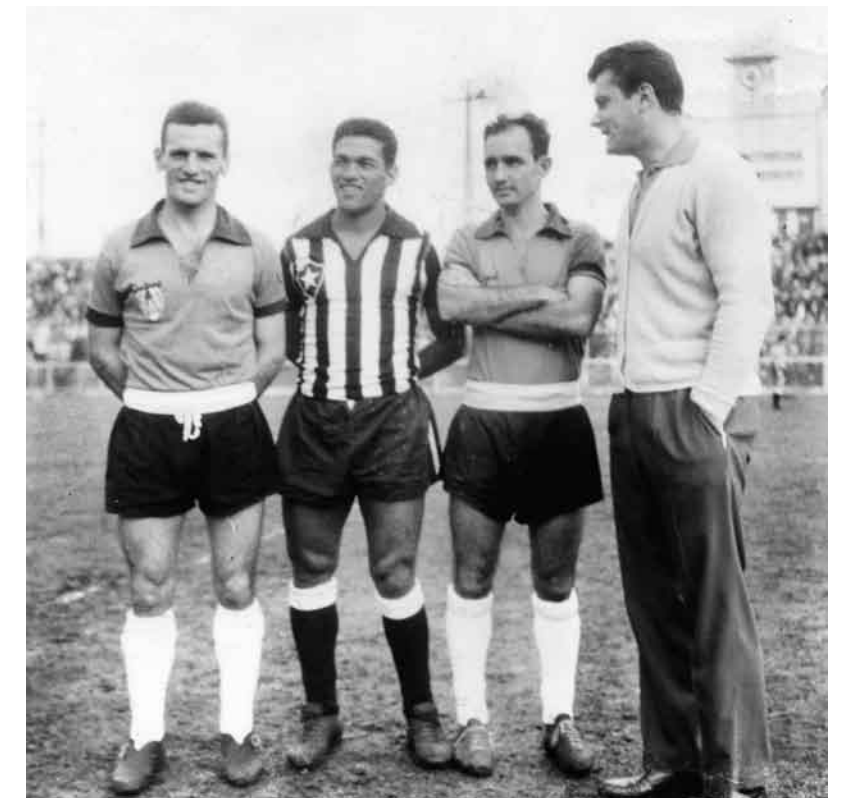
Com Garrincha, nos 60s, na partida Ferroviário (PR) x Botafogo (RJ).