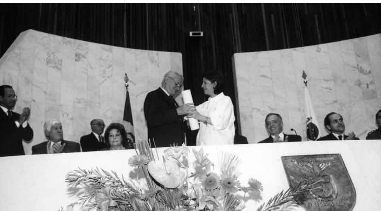
Recebendo o título de “Cidadão Benemérito” da Assembleia Legislativa.