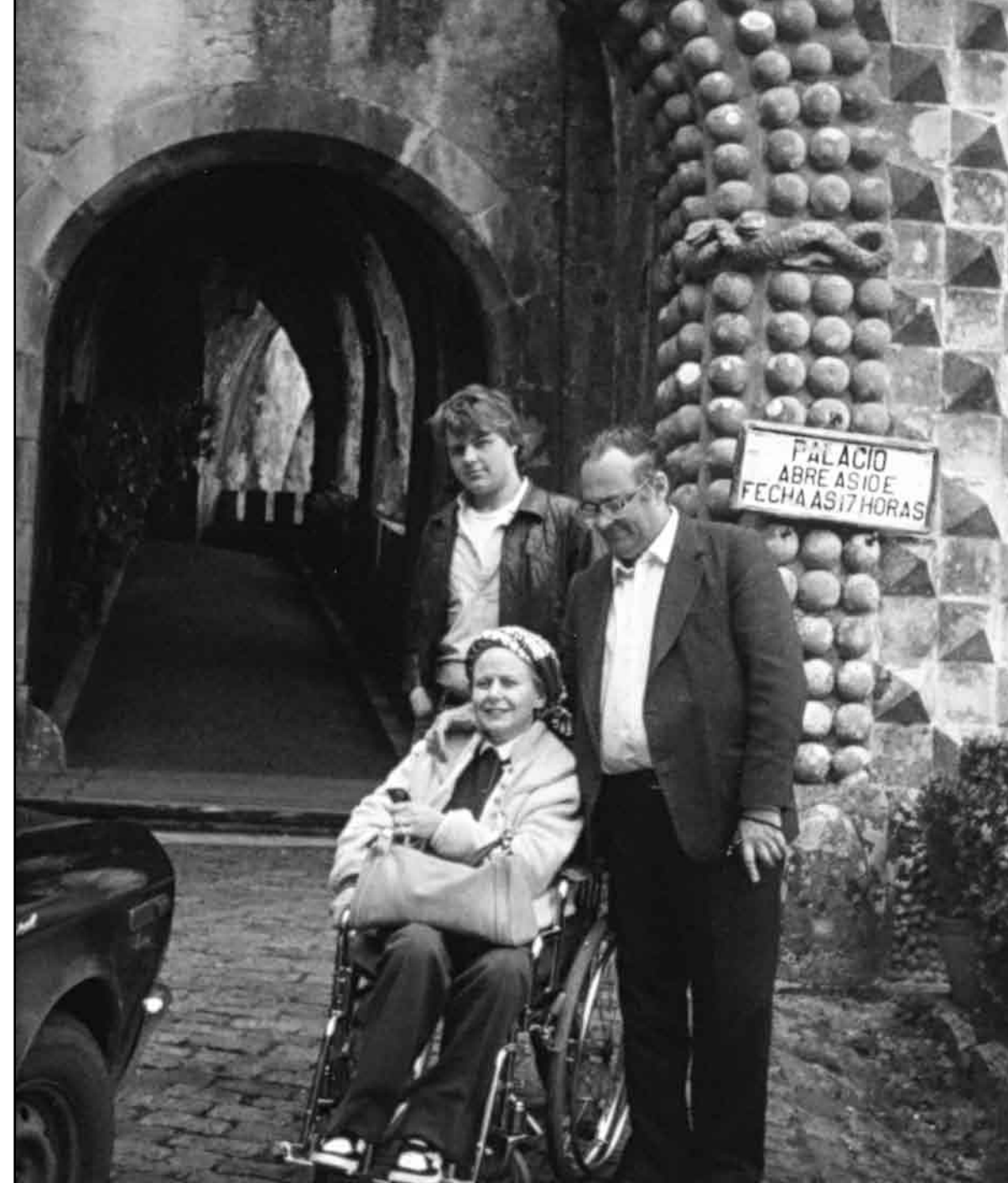
Com o pai e a mãe, em Portugal.

critério de advocacia. Foi no início dos anos Oitenta, enquanto começava o curso de Ciências Sociais na Pontifícia Universidade Católica.