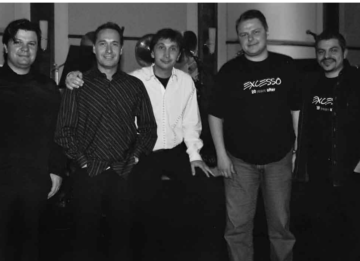
Com a banda “Excesso Lateral”.

A imersão, desse jeito, nas vísceras da atividade empresarial, antecipou-lhes realidades que, de outra forma,