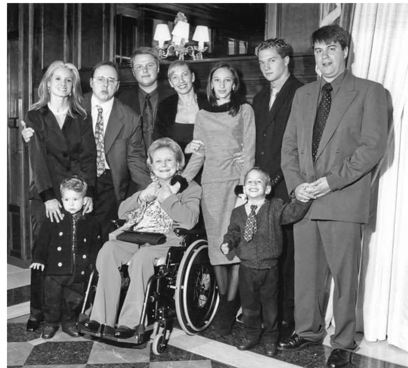
Com a mãe, irmãos, sobrinhos e cunhada.

poderiam conhecer muito mais na teoria e nos tratados acadêmicos.