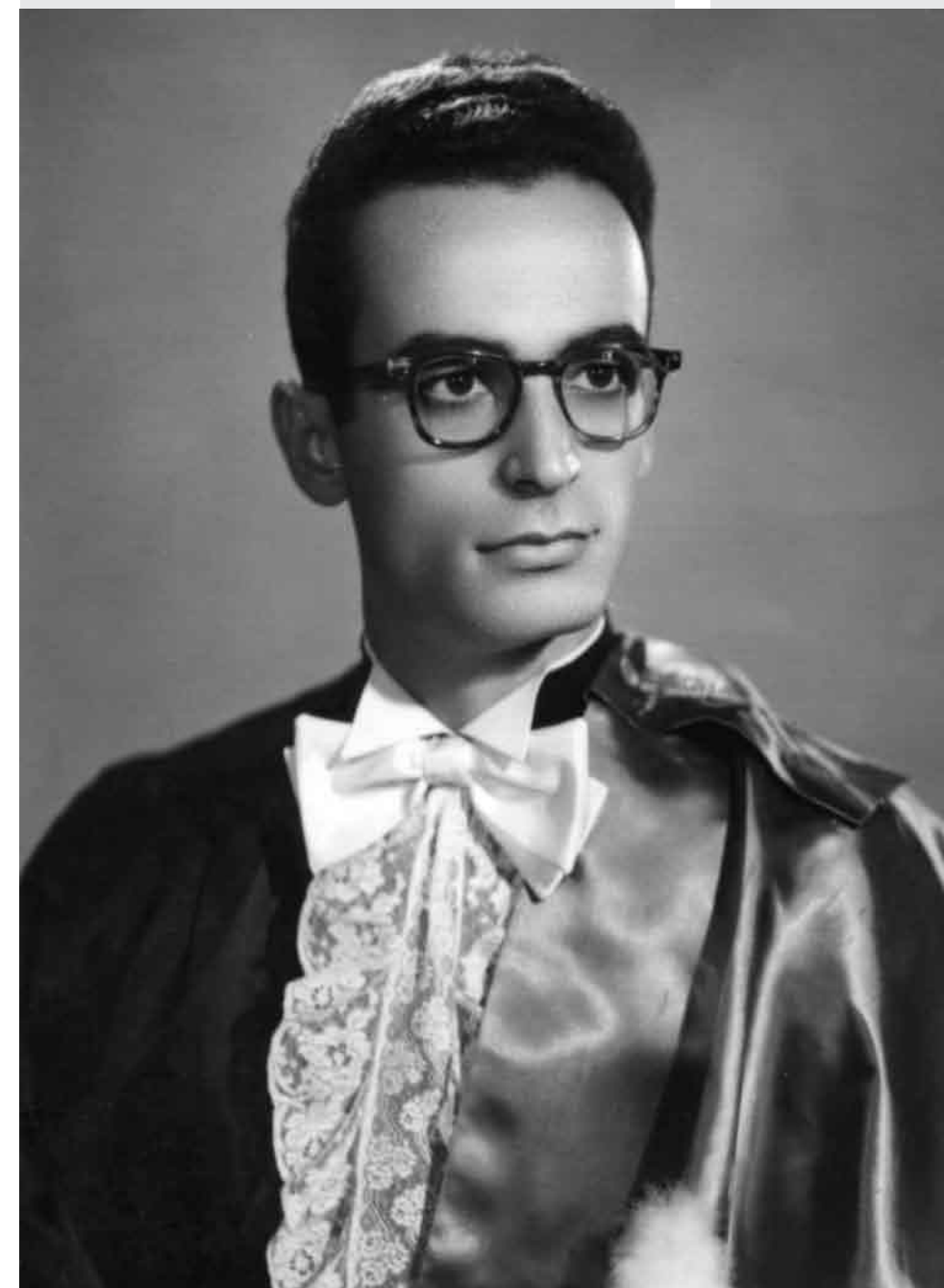
Formatura de Odontologia (1956).

rios veículos de manifestação além do corpo material. Mas não é igual ao Oriente, que acredita que são sete ou dez. Nós achamos também que a pessoa tem a seriexologia, ou seja, a reencarnação. A pessoa tem vidas sucessivas em um processo que segue a escala evolutiva da consciência. Vai chegar um tempo em que a pessoa se torna serenão (quando já está nas últimas encarnações) e depois consciex (consciência extrafísica) livre. Quando chega nesse ponto, a pessoa dispensa o processo desses corpos. Então, fica a consciência mais pura, sem a necessidade de um corpo físico para se manifestar.”