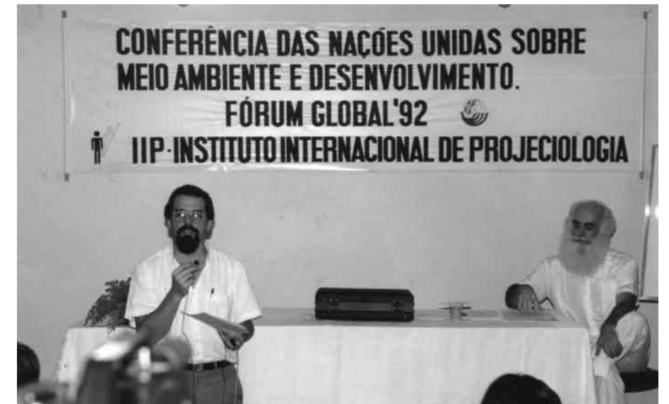
Waldo participou das conferências do Fórum Global, no Rio de Janeiro (Eco 92).

dormir, diz ter experimentado sair do corpo e presenciado uma sessão espírita que estava sendo conduzida em um outro cômodo da casa, para curar o irmão epilético. Posteriormente, descreveu os acontecimentos e as pessoas que estavam presentes para os pais, sendo que uma delas só foi visível para Vieira. Seria um espírito amparador. Como era bom desenhista, o pai lhe pediu que fizesse um desenho do sujeito desencarnado. Um dos presentes reconheceu a imagem como sendo da pessoa que dava nome ao centro espírita que frequentavam, já morta há muitos anos.